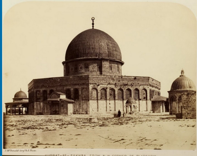
Rotskoepel Moskee Al Aqsa Begin 20 ste eeuw