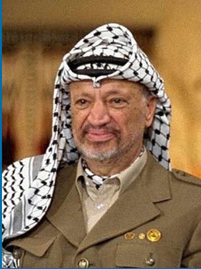
Yassar Arafat Cairo Egypt 1929 12 nov. 2004